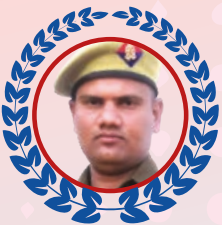
Chetan UP POLICE